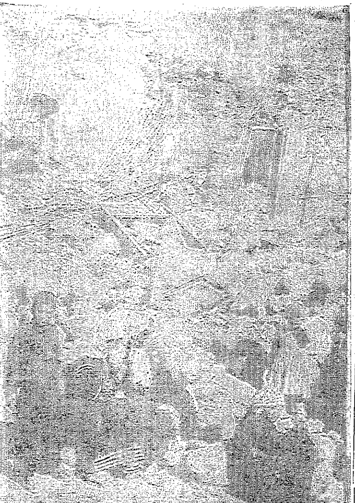
كثرت هذه منازل نوح بالحياة، حولها البرابرة الاسرائيليون الى اطلال وخرائب وشردوا والامتن من اهلها

تعلن عن تزويجات هائلة على جميع اصناف الخيوط الصوفية اعتباراً من ١٢-١١-١٩٦٨ ولغاية ٢٠-١٢-١٩٦٨ من ١٠ بالقة الى ٥٠ بالقة اغتنموا هذه الفرصة ولا تدموها تفوتكم الكمية محدودة والاسعار مغرية جداً